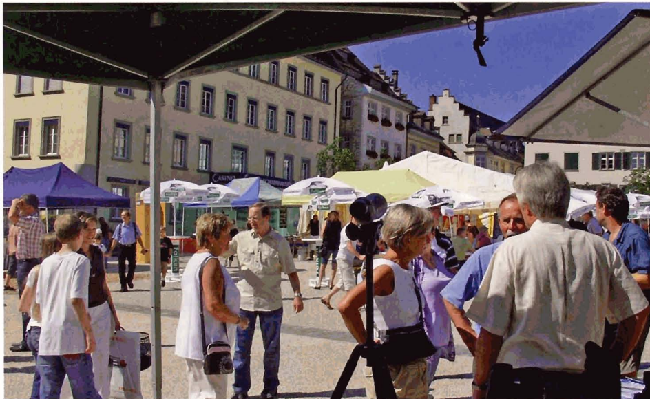
In der Schaffhauser Altstadt war die Jagd buchstäblich «bei den Leuten».