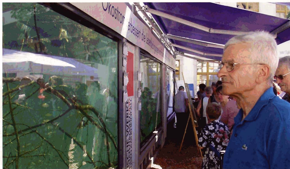
Eine besondere Attraktion war das mobile Aquarium der Fischer.