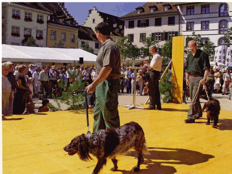
Die von Jean A. Vuilleumier kommentierte Hundeparade fand Aufmerksamkeit und Beifall.